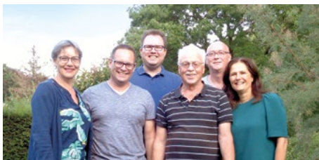
Werkgroep Oude Gracht Hartveilig

Op maandag 23 september organiseren wij in de Petraschool (Faunuslaan 19)